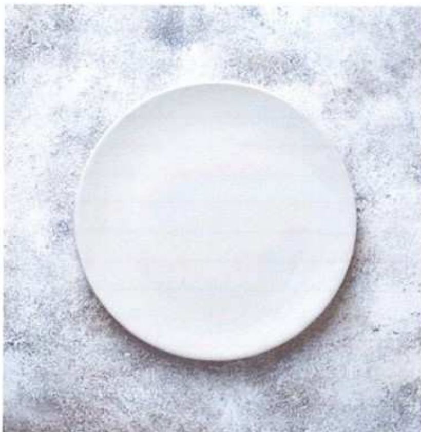
L'assiette, symbole à la fois de partage et d'exclusion, incarne les défis sociaux et politique de l'alimentation.

L'idée de sécurité sociale de l'alimentation (SSA) repose sur trois piliers : le droit à la production, à la nature et à l'alimentation. Cela implique de réduire le gaspillage, soutenir les plus démunis et valoriser une agriculture respectueuse de l'environnement.